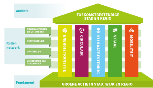
Figuur 1 EGC

De thema's energie, klimaatbestendig, circulair, mobiliteit en vitaal worden ondersteund door de Sustainable Development Goals. In alle fasen van het inkoopproces worden de effecten op people (mensen), planet (planeet/milieu) en profit/prosperity (winst/welvaart) meegenomen.